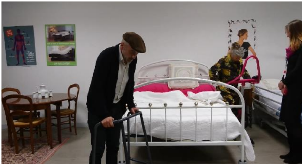
Centrum Wsparcia Opiekunów Nieformalnych Pôles Aidant /Aidé prowadzone przez Stowarzyszenie w Limoges (Nowa Akwitania, Francja)